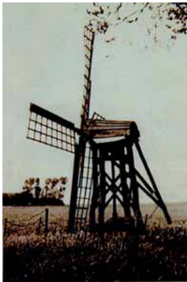
Eenvoudig poldermolentje, zoals dat rond de eeuwwisseling te vinden was op het Kampereiland; dit exemplaar behoorde bij Stads erf 31.